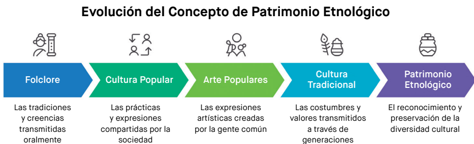
Esquema N° 2: Evolución del concepto de patrimonio etnológico.

En España, Santamarina et al. lo definen como el «conjunto de las manifestaciones y formas de vida tradicionales, materiales o inmateriales, que definen las características propias de los distintos grupos que conforman una colectividad» (2008: 211). Asimismo, Pereiro y Prado indican que «el concepto de patrimonio etnológico tiene sus raíces en el de folclore, que luego se fue redefiniendo como cultura popular y tradicional. El mismo concepto ha ido evolucionando hasta formar una especie de continuum » (2021: 35).